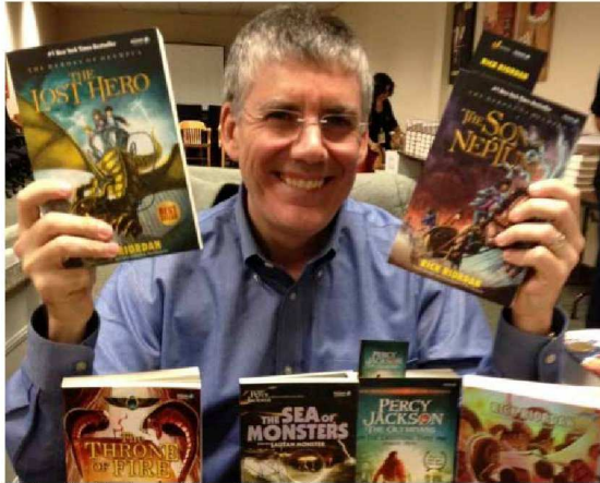
L'autore Rick Riordan con il libro di Percy Jackson

Dopo questa serie Rick scrisse anche Eroi dell'Olimpo composto da 5 libri.