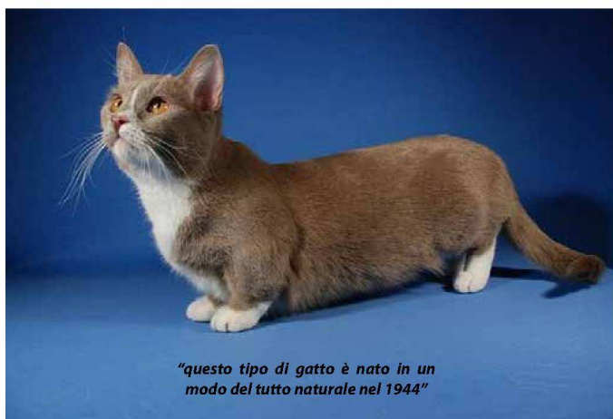
"questo tipo di gatto è nato in un modo del tutto naturale nel 1944"