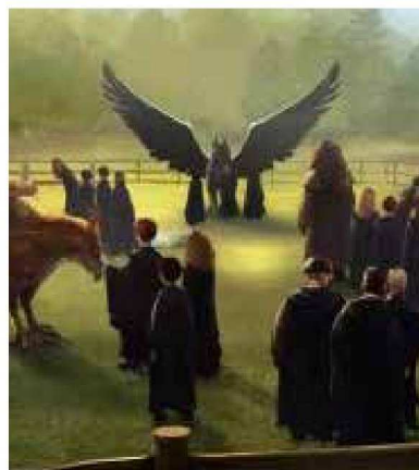
Animali fantastici dove trovarli?

L'autrice del libro è anche la sceneggia-